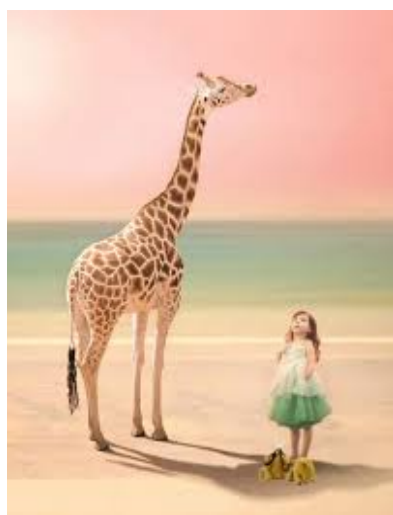
Affiche de la pièce

Ce spectacle théâtral raconte l'histoire d'une petite fille qui, à l'école, doit réaliser un exposé sur les Girafes. En rentrant chez elle, elle annonce à son père qu'elle doit absolument regarder des documentaires sur la chaîne « Discovery channel». Malheureusement, son père est débordé par toutes ses factures et ne peut pas payer l'abonnement à cette chaîne. Mais sa fille, entêtée, ne peut s'empêcher de partir avec son doudou pour chercher un maximum d'argent.